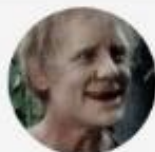
Uncle Jack Senior Member Cumbria, UK British English