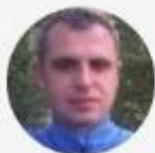
Andrew1980 Senior Member Khmelnitskiy, Ukraine Ukrainian